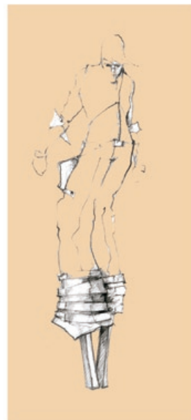
az illusztráció a KEMFK látványtervező szakos hallgatói

A kórus többszörös kategória győztese különböző nemzetközi kórusversenyeknek.