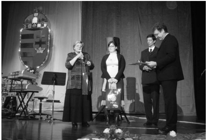
A pécsi delegáció köszöntője

S ejtessék szó a báli ételekről is: válsztható volt – több más mellett Gulyás és Bécsi szelet, de a legnépszerűbbek a sütemények voltak talán azért is, mert ezeket a klasszikus magyar édességeket itt, németföldön – más alkalommal nem igen lehet kóstolgatni. A szervezők s valamennyiünk nagy meglepetésére (sokak bosszúságára) a sütemény – így a Krémes, a Dobos torta, a Gesztenye-torta – készlet 21 órára kimerült! Ehhez tudnunk kell, hogy a németországi étkezési hagyomány szerint a tortát és egyéb nyalánkságokat a délutáni kávé mellé fogyasztják, ezért