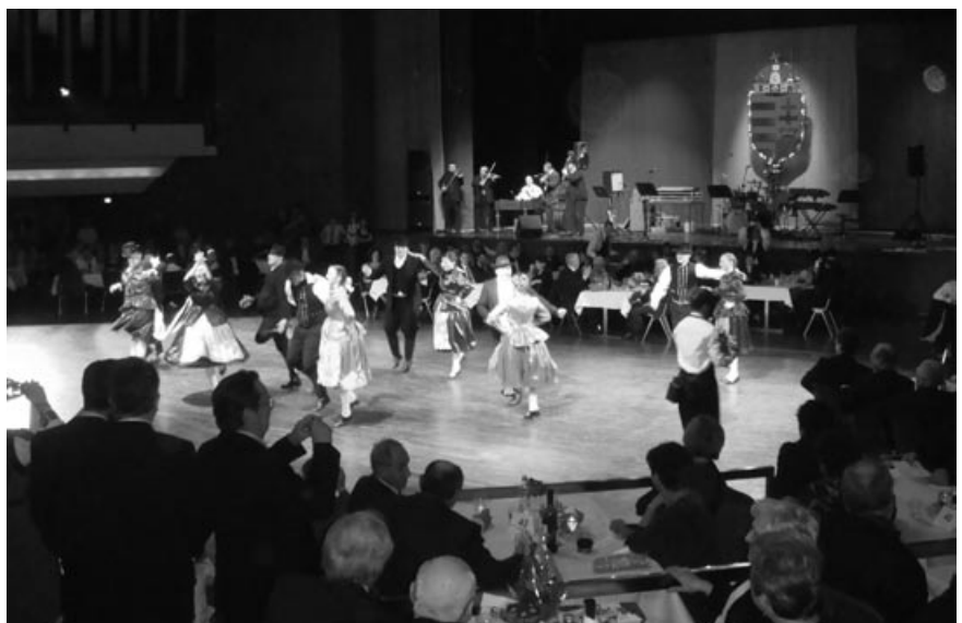
Dél-alföldi táncok Csöbörccök módra