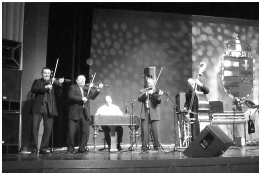
A Duvo együttes

A megjelent közönség elsősorban magyar anyanyelvű vagy magyarországi származású volt, akik a legkülönbözőbb időszakban telepedtek meg önként vagy kényszerítetten Baden-Württemberg tartományban. Ide kell sorolni a 2. világháborút követően kitelepített magyarországi svábok képviselőit is, az 56-os generációt és azokat is, akik napjainkban teszik át ide ideiglenesen vagy véglegesen lakhelyüket. (Igaz – a beszélgetéseim során az derült ki, hogy nagyon sokan csak átmenetinek tekintik itt tartózkodásukat.) Meg kell említeni az Erdélyből, Pártiumból, Bácskából, a Felvidékről, a Vajdaságból érkezetteket is, hiszen számuk jelentős! (Stuttgartban és környékén kb. 40.000 magyar él). A német autópálya-hálózat következtében az emberek általában mobilabbak, egy-egy magyar rendezvény vonzáskörzete igen széles, így ezúttal is találkoztunk frankfurti és müncheni vendégekkel is (kb. 200 km. mindkét város), no és a magyar ajkúak német barátaival, de hallottunk szerb és román szót is.