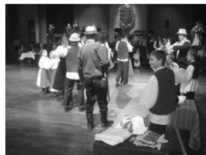
A Cserkészek bemutatója

A hivatalos program 20 órakor, a köszöntők sorával indult. Ekkor kapott szót a pécsi delegáció vezetője,